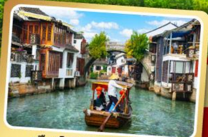
เมืองโบราณจูเจียเจี้ยว

พักโรงแรม 4 ดาว รวมอาหารเช้า เมนูพิเศษ Buffet BBQ+สุกี้หม่าล่า