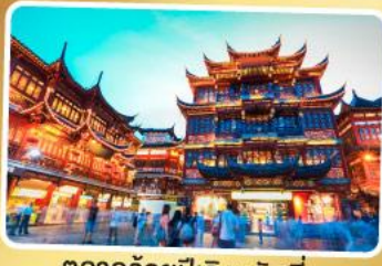
ตลาดร้อยปีอิงหวังเมี่ยว