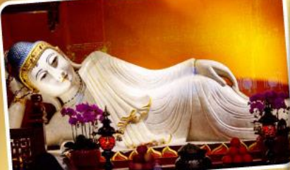
วัดพระหยกขาว