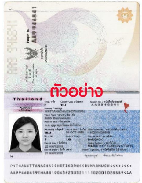
ตัวอย่าง รูปถ่าย 2 นิ้ว