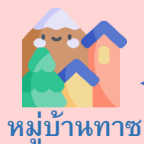
หมู่บ้านทาช

เที่ยง บริการอาหารกลางวัน ณ ภัตตาคารอาหารจีน (7)