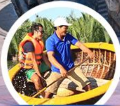
นั่งเรือกระถัง