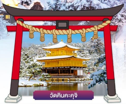
วัดคินคะคุจิ