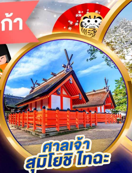
ศาลเจ้า สุมิโยชิ ไทระ