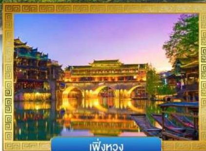
เฟิ่งหวง