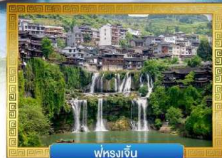
ฟูหลงเจิน