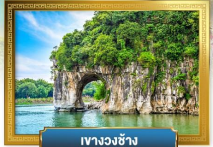
เหวางวงซ่าง