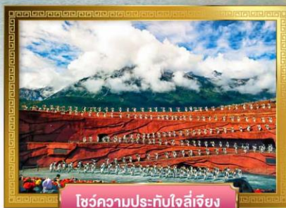
โซ่วความประทับใจลี่เจียง