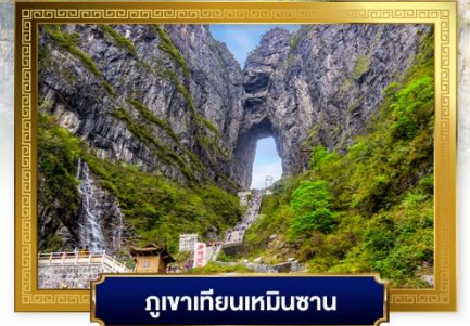
ภูเขาเทียนเหมินซาน