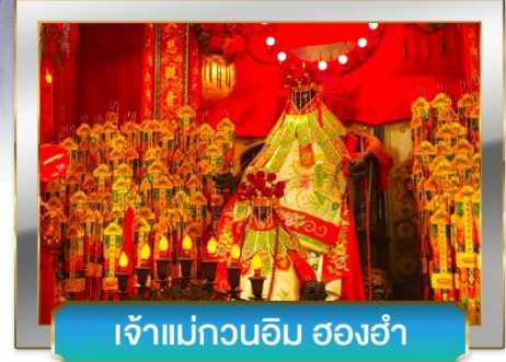
เจ้าแม่กวนอิม ฮองอ่า