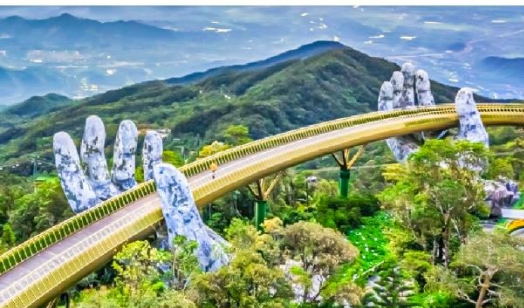
สะพานมือบานาฮิลล์