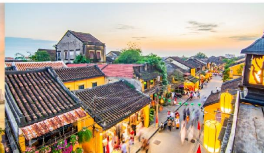
หมู่บ้านฮอยอัน

*กรณีห้องพัkbานาฮิลล์เต็ม ขอสงวนสิทธิ์ในการเปลี่ยนวันเข้าพัก และปรับเปลี่ยนโปรแกรมโดยคำนึงถึงผลประโยชน์ลูกค้าเป็นสำคัญ