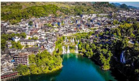
ฝูหรงเจิน