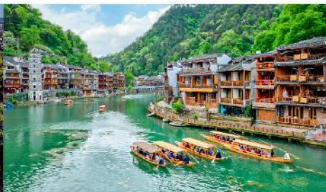
เมืองเฟิ่งหวง