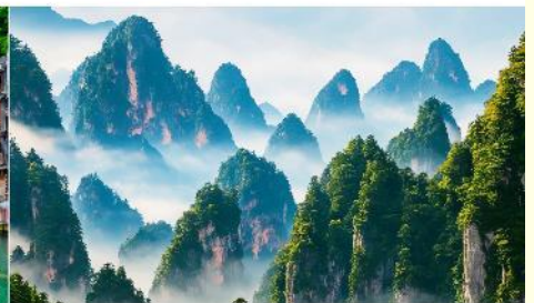
เขาเทียนช้อซาน

*ทางบริษัทฯ ขอสงวนสิทธิ์ในการสลับโปรแกรมทัวร์ตามความเหมาะสมขึ้นอยู่กับสถานการณ์หน้างาน โดยคำนึงถึงผลประโยชน์ของลูกค้าเป็นสำคัญ