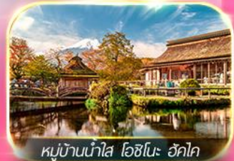
หมู่บ้านน้ำใส โอชิโนะ อักโท