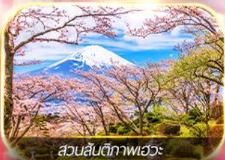
สวนสันติภาพเอวะ