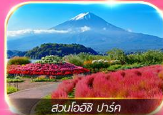
สวนโออิชิ มาร์ค