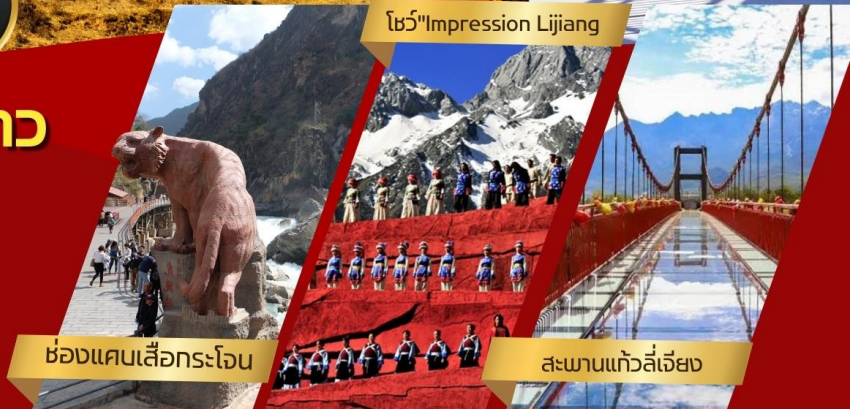
ช่องแคบเสื่อกระโถน