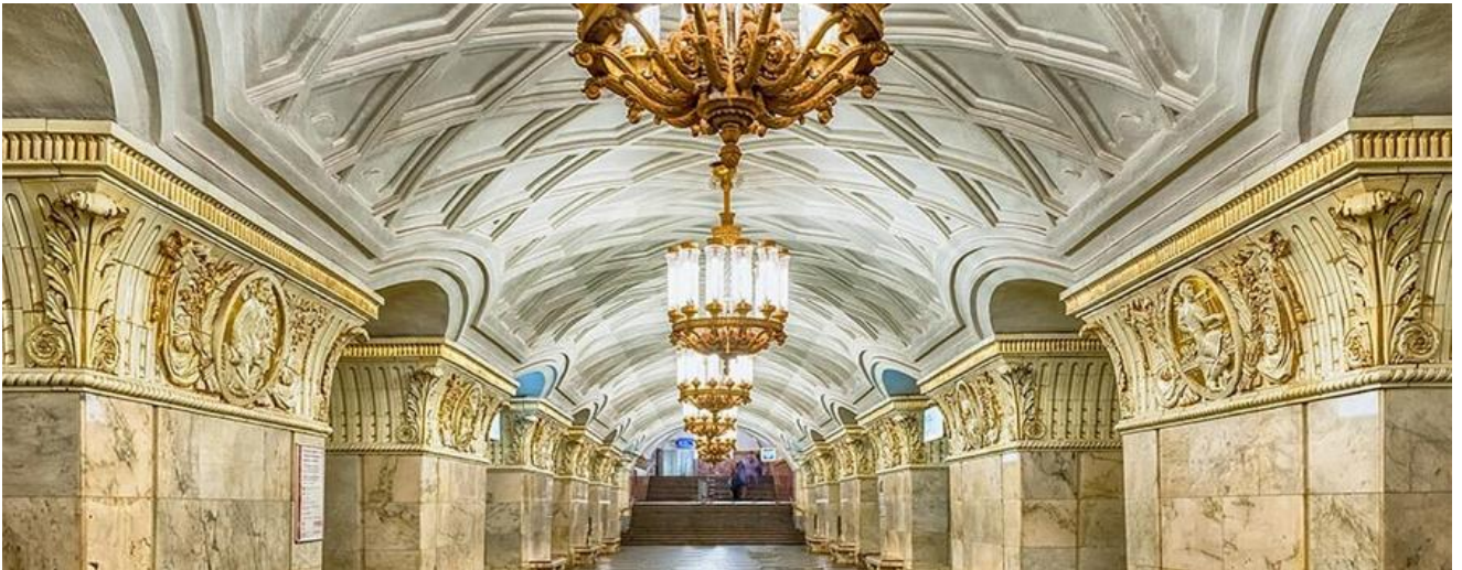
ค่ำ รับประทานอาหารค่ำ ณ ภัตตาคาร (12)

นำท่านเที่ยวชมสถานีรถไฟใต้ดิน เป็นสถานีรถไฟใต้ดินที่สวยงามที่สุดในโลกแล้วยังมีความลึกอีกต่างหาก รถไฟใต้ดินทำให้ผู้คนสามารถเดินทางไปไหนมาไหนได้สะดวกกว่าบนถนนทั่วไป สถานีรถไฟใต้ดินเป็นสิ่งก่อสร้างที่ชาวรัสเซียสามารถอวดชาวต่างชาติให้เห็นถึงความยิ่งใหญ่ตลอดจนประวัติศาสตร์ความเป็นชาตินิยมและวัฒนธรรมประเพณีอันสวยงามอันเป็นเสน่ห์ดึงดูดให้นักท่องเที่ยวมาเยี่ยมชมเนื่องจากการตกแต่งของแต่ละสถานีที่ต่างกันด้วยประติมากรรม โคมไฟระย้า เครื่องแก้ว และหินอ่อน