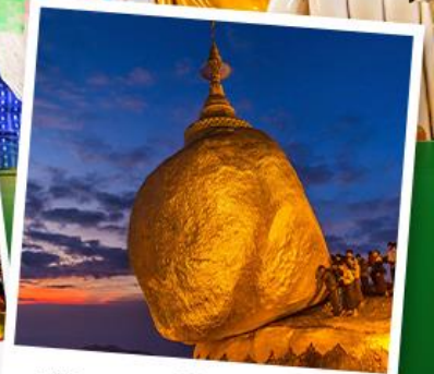
พระธาตุอินทร์แขวน