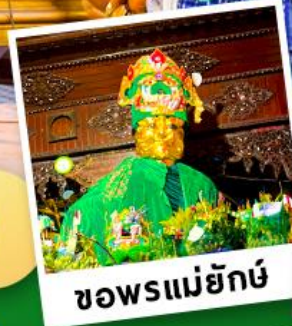
ขอฟรแม่ยักย์