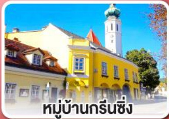
หมู่บ้านกรีนซิ่ง