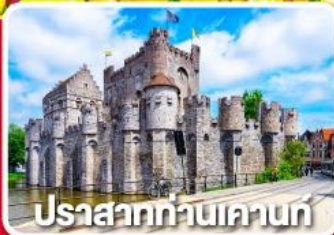
ปราสาทท่านเคานท์