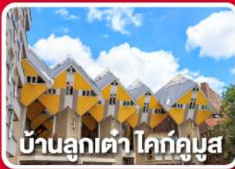
บ้านลูกเต่า โคทคูบุง