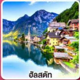
ฮัลสตัดท์