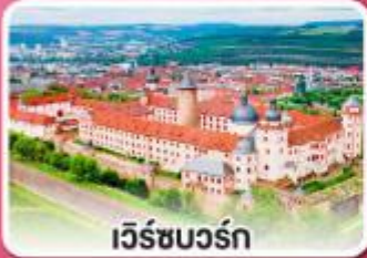
เว็ร์ชบวร์ค