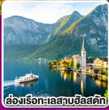
ล่องเรือทะเลสาบฮัลสตัค

พิเศษ! เมฆสีขาวปลอดดิว เปิดป่าทึบ และ ชูปกูลาช