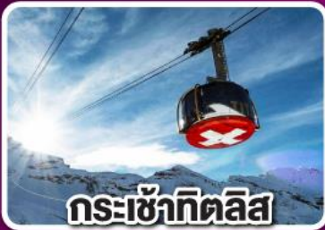
กระเช้าเทคิลิส