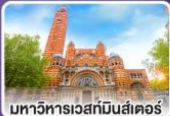
มหาวิหารเวสต์มินสเตอร์