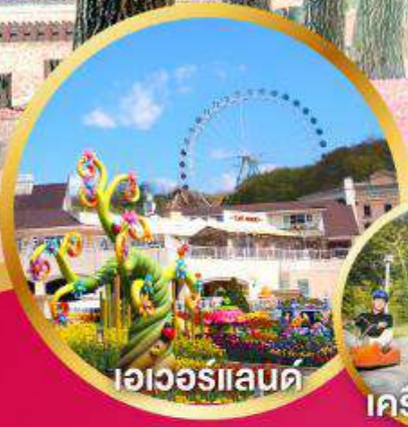
เอเวอร์แลนด์