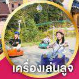
เครื่องเล่นลู่จ