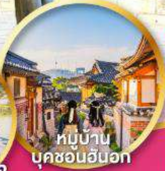
หมู่บ้าน บุคซอนอันอก