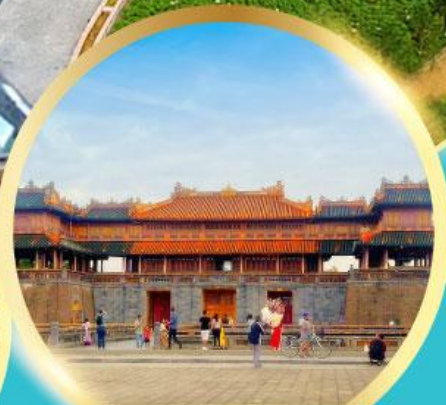
พระราชวังโบราณไดโนย

เมนูพิเศษ! กุ้งมังกรชอสเนย + หม้อไฟ ทะเล SEAFOOD 1 มื้อ, บึงย่าง ชาญ 1 มื้อ