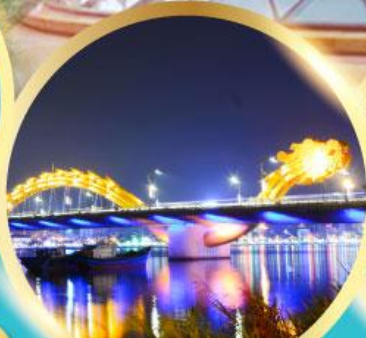
สะพานมังกรพันไฟ