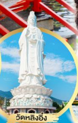
วัดหลิ่งอิง