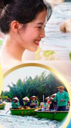
ล่องเรือกระด้ง