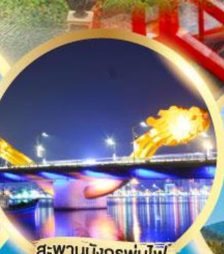
สะพานมังกรพันไฟ