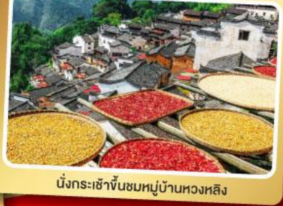
บึงกระเช้าขึ้นชมหมู่บ้านหวงหลิง