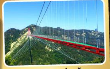
สะพานแขวนอ้ายจ้าย