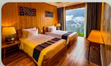
Lady Hills Sapa โรงแรมระดับ 5 ดาว 2 คืน