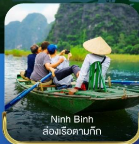
Ninh Binh ส่องเรือตามถ้ำ