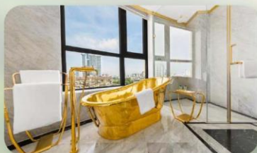
WYNDHAM GOLDEN LAKE โรงแรมระดับ 5 ดาว 1 คืน