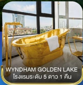
WYNDHAM GOLDEN LAKE โรงแรมระดับ 5 ดาว 1 คืน