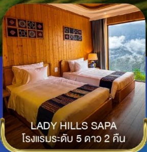
LADY HILLS SAPA โรงแรมระดับ 5 ดาว 2 คืน