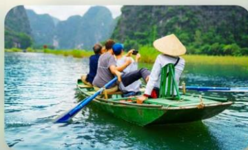
Ninh Binh ล่องเรือตามกัก