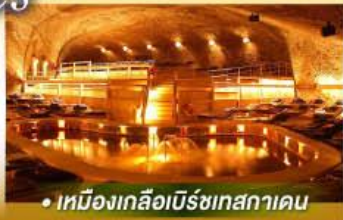
• เมืองเกลือบิรชเทสกาเดน