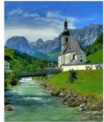
ออสเตรียบาวาเรียดินแดนแห่งเทพนิยาย

ออสเตรีย – บาวาเรีย (Austria-Bavaria) ดินแดนวัฒนธรรมเก่าแก่ที่ครอบคลุมสองประเทศและแทบแยกกันไม่ออกเลยที่เราเที่ยวอยู่ในออสเตรียหรือเยอรมัน ท่านจะประทับใจไปกับหมู่บ้านเล็กๆน่ารัก ที่ตั้งอยู่บริเวณริมทะเลสาบในเทือกเขา “เยอรมัน-ออสเตรียแอลป์” พร้อมบริการอาหารรสเลิศและที่พักอย่างดีระดับ 4 ดาว หรูหราที่เราคัดสรรมาให้ท่านได้พักผ่อนอย่างเต็มที่ให้การเดินทางของท่านคุ้มค่าที่สุดในเส้นทางที่สวยงามที่สุดของออสเตรีย-บาวาเรีย