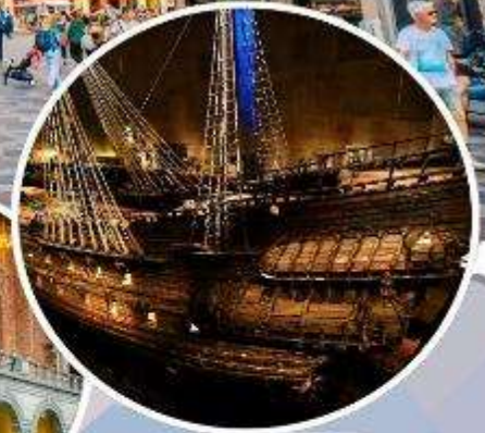
เข้าชม “พิพิธภัณฑ์เรือวาซา”