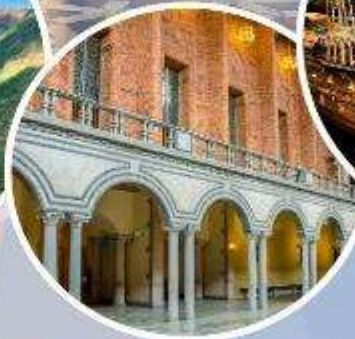
เข้าชมศาลาว่าการ กรุงสต็อกโฮล์ม