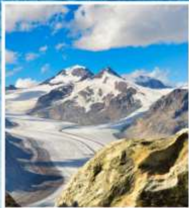
ALETCH GLACIER Riederalp, Bettmeralp

แกรนด์สวิตเซอร์แลนด์ 9 วัน QR พักหมู่บ้านเชอร์แมท(พ.ย./มี.ค.)