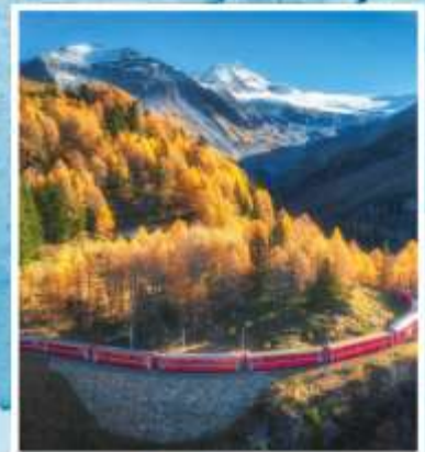
BERNINA EXPRESS Unesco World Heritage

ราคาพิเศษเริ่มต้นเพียง 119,900.- (รวมค่าวีซ่า)