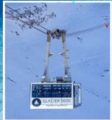
GLACIER3000 Peak walk by Tissot