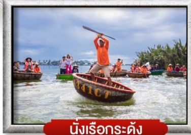
นั่งเรือกระดัง